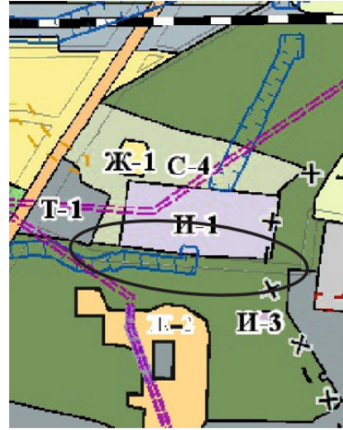
территория пл. 3096 кв.м, в районе земельного участка с кадастровым номером 90:19:010103:1500

Территориальная зона, в соответствии с картой градостроительного зонирования, утвержденной решением 108 сессии Кернского городского совета 1 созыва от 31.01.2019 № 1550-1/19