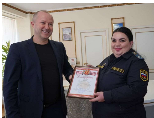
На вручении городских наград от имени Главы муниципального образования.