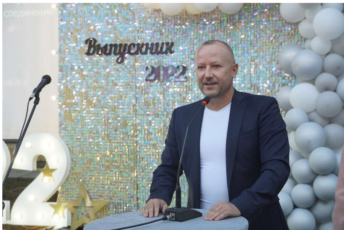
На вручении дипломов в Керченском политехническом колледже.

- Депутатский контроль за благоустройством общественных территорий.