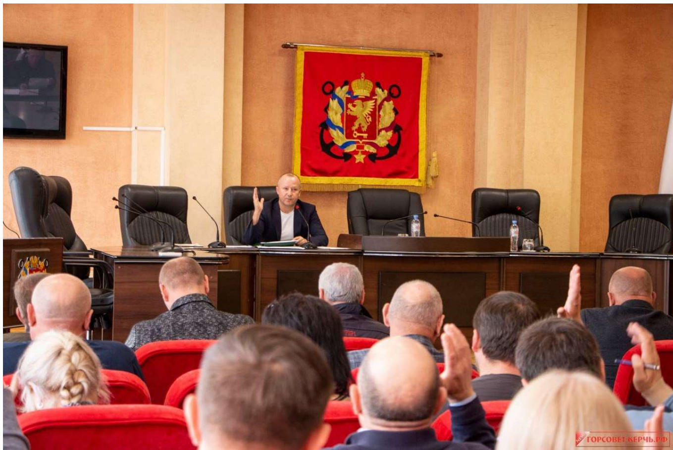
В сессионном зале Керченского городского совета.

За отчётный период Керченским городским советом проведено 18 сессий, на которых принято 315 муниципальных правовых актов. Отсутствовал на 4 сессиях в связи со служебными командировками и ежегодным отпуском по основному месту работы.