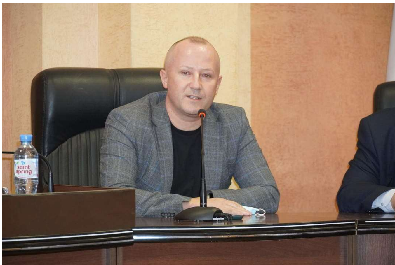
На заседании комиссии.

- рабочая группа по рассмотрению инвестиционных проектов, на которой рассматриваются предложения заинтересованных субъектов хозяйствования о реализации на территории города своих проектов. В отчётном периоде участвовал в 1 заседании такой рабочей группы.