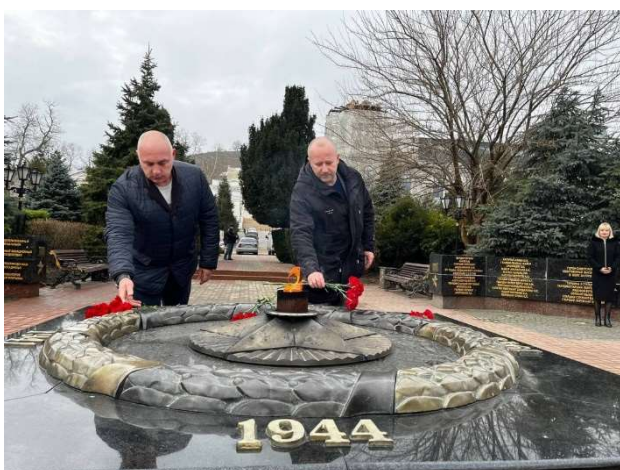
Возложение цветов в памятные дни.