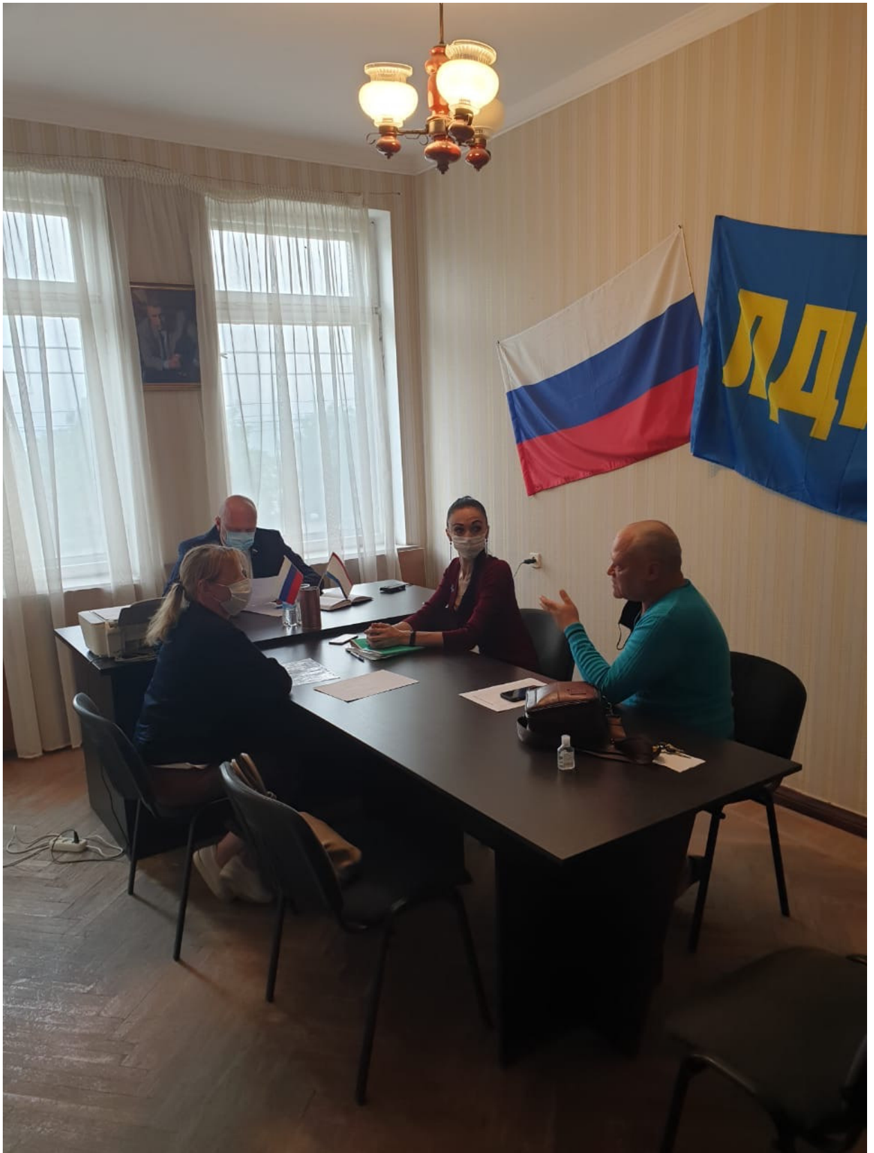
Депутат Керченского городского совета 2 созыва-34человека.