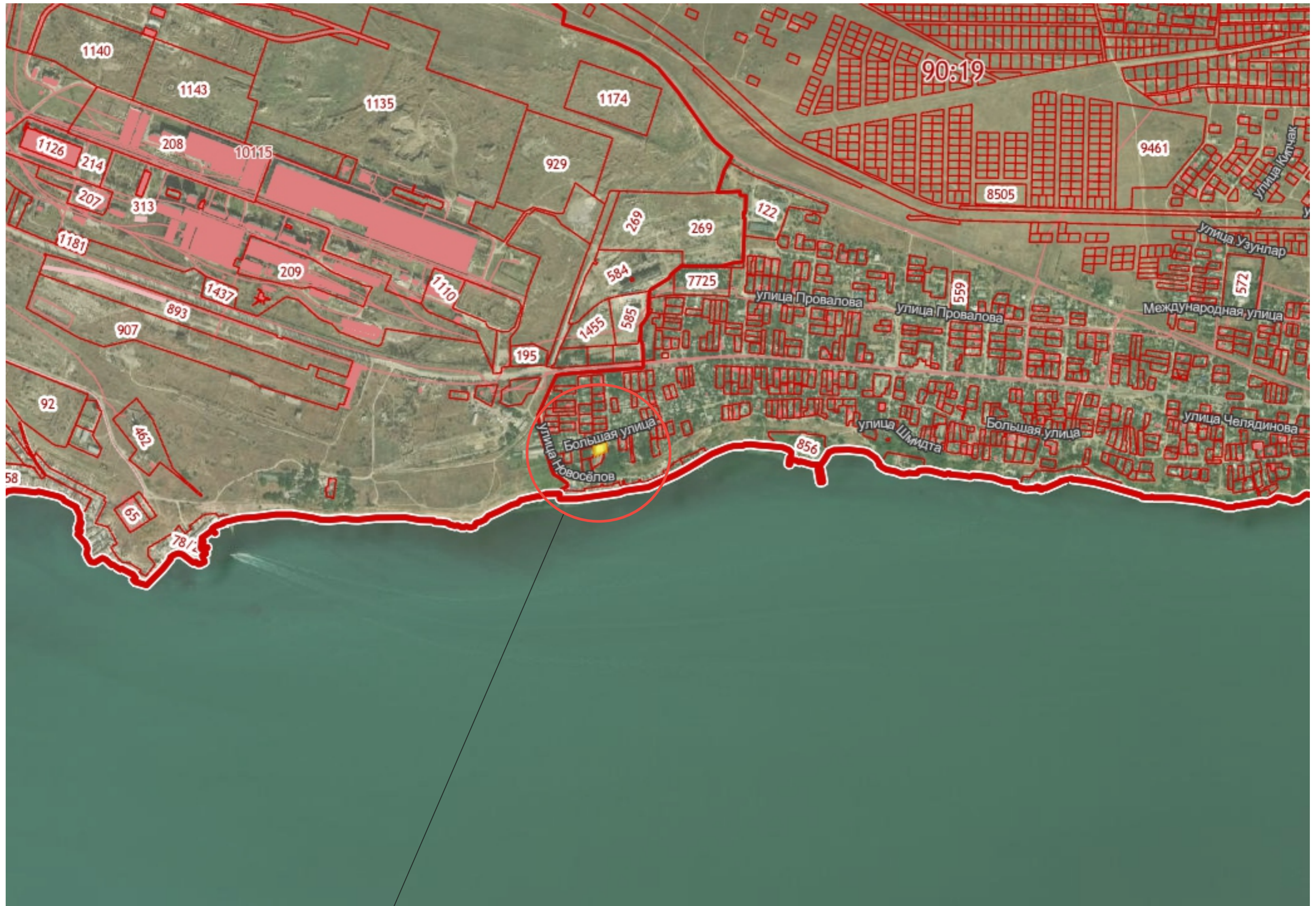
Местоположение земельного участка по пер. Лагерный, 20-б