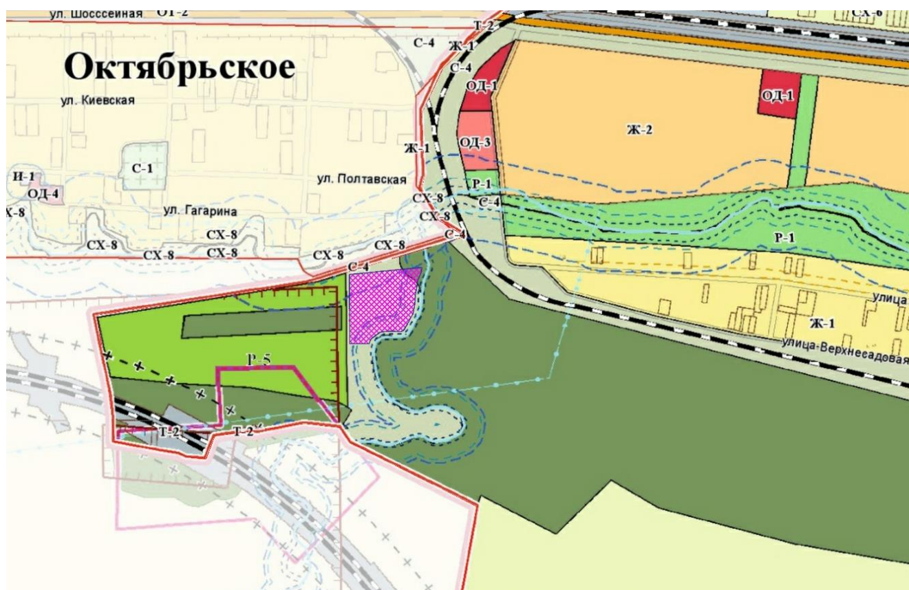
Рисунок 1 - Зона формирования компенсационного участка городских лесов

Администрация города Керчь определила зону формирования компенсационного участка городских лесов ориентировочной площадью 3,5 га, формируемого с целью обеспечения баланса площадей в результате раздела земельных участков лесного фонда с кадастровыми номерами 90:19:000000:287 и 90:19:010105:17075 (Рисунок 1). Координаты сформированного участка представлены в Приложении 8.1.